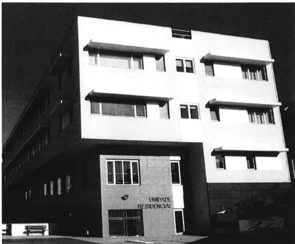
ERPI / Estrutura Residencial Para Idosos Liga de Amigos do Hospital Garcia de Orta